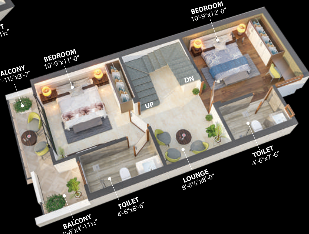
फर्स्ट फ्लोर प्लान