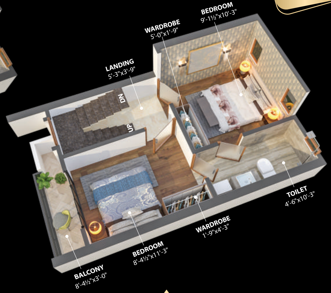
फर्स्ट फ्लोर प्लान