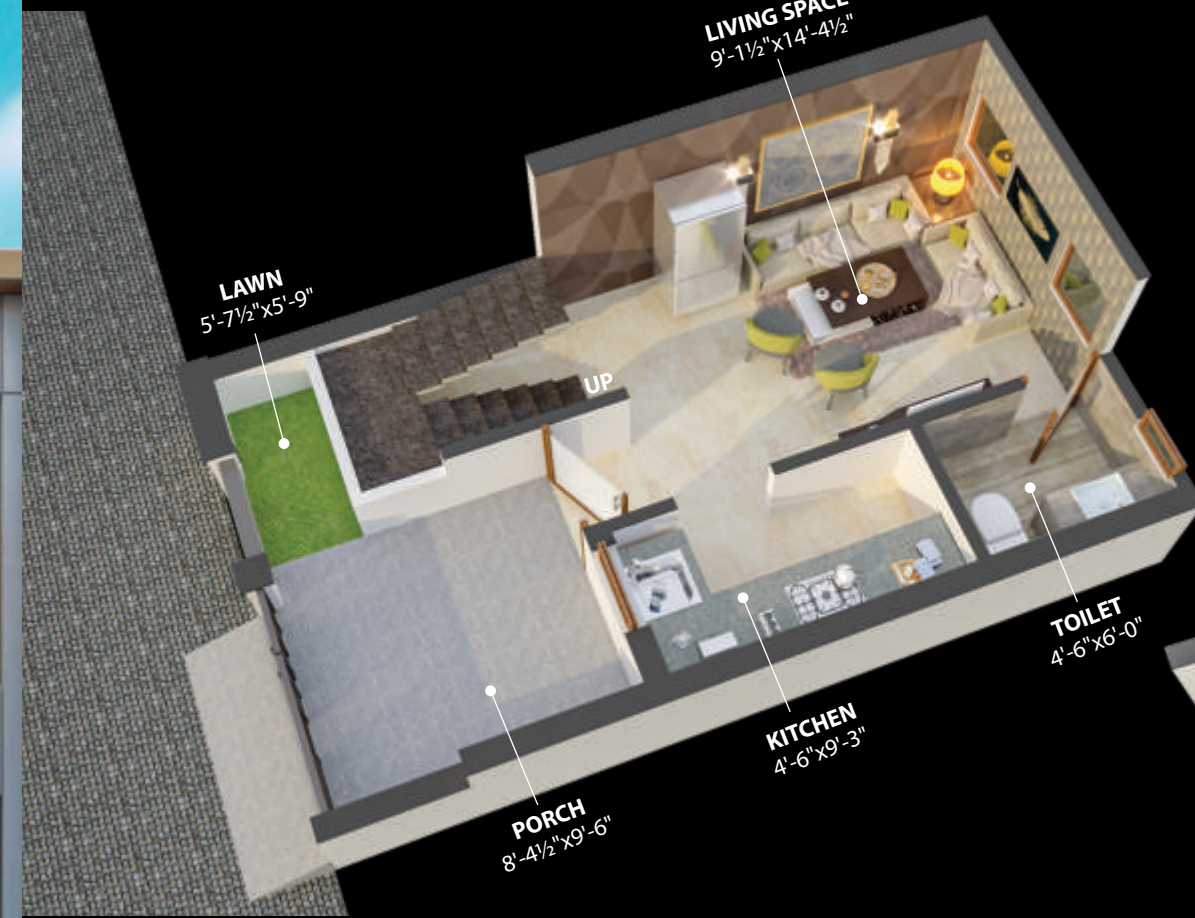
ग्राउंड फ्लोर प्लान