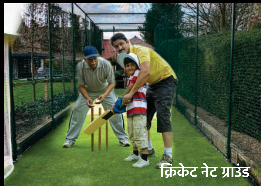
क्रिकेट नेट ग्राउंड