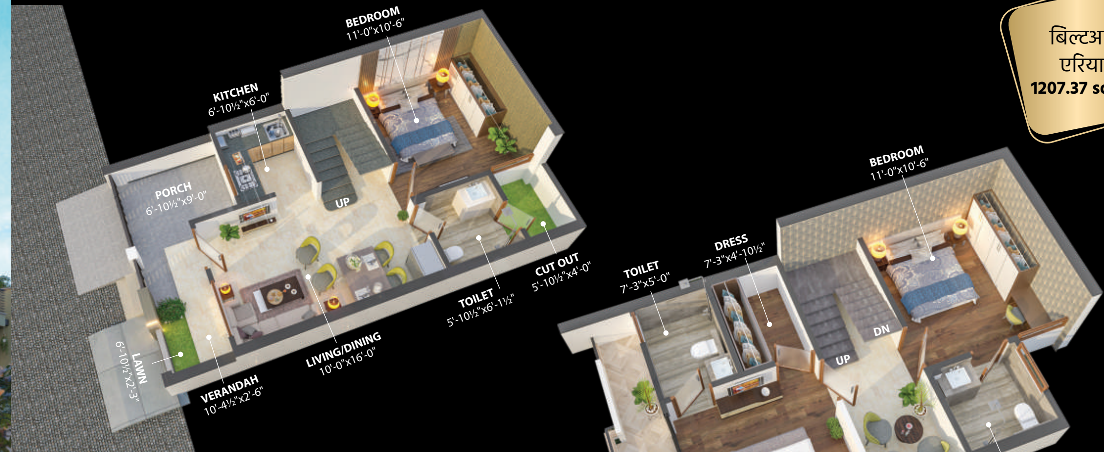
ग्राउंड फ्लोर प्लान