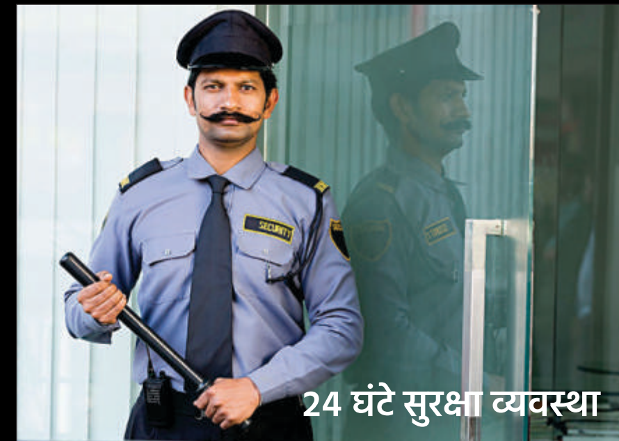
24 घंटे सुरक्षा व्यवस्था