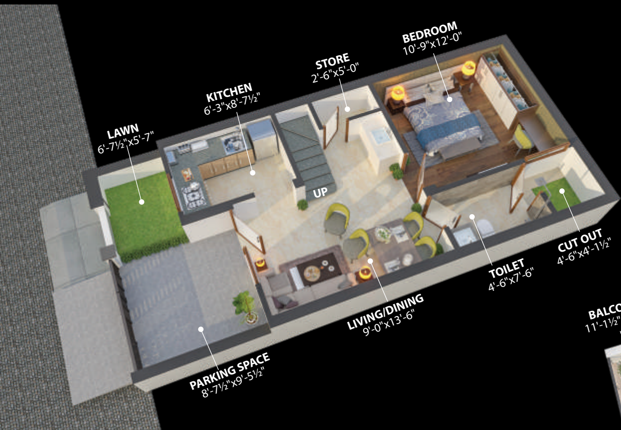
ग्राउंड फ्लोर प्लान