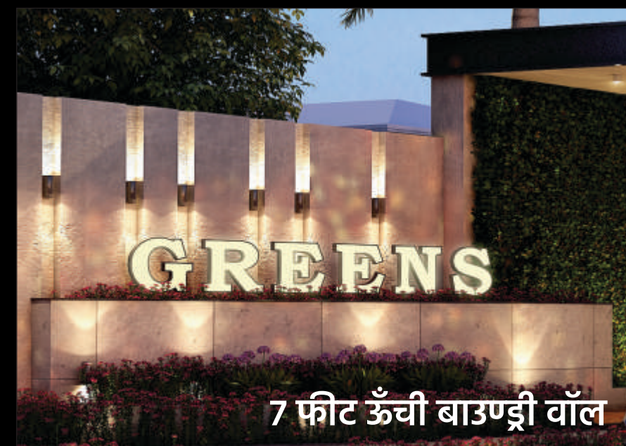
7 फीट ऊँची बाउण्ड्री वॉल