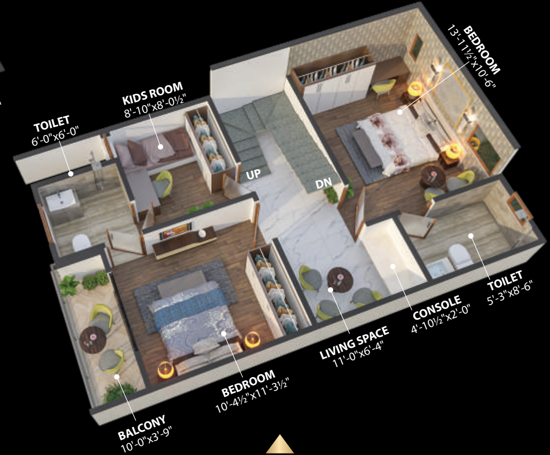
फर्स्ट फ्लोर प्लान