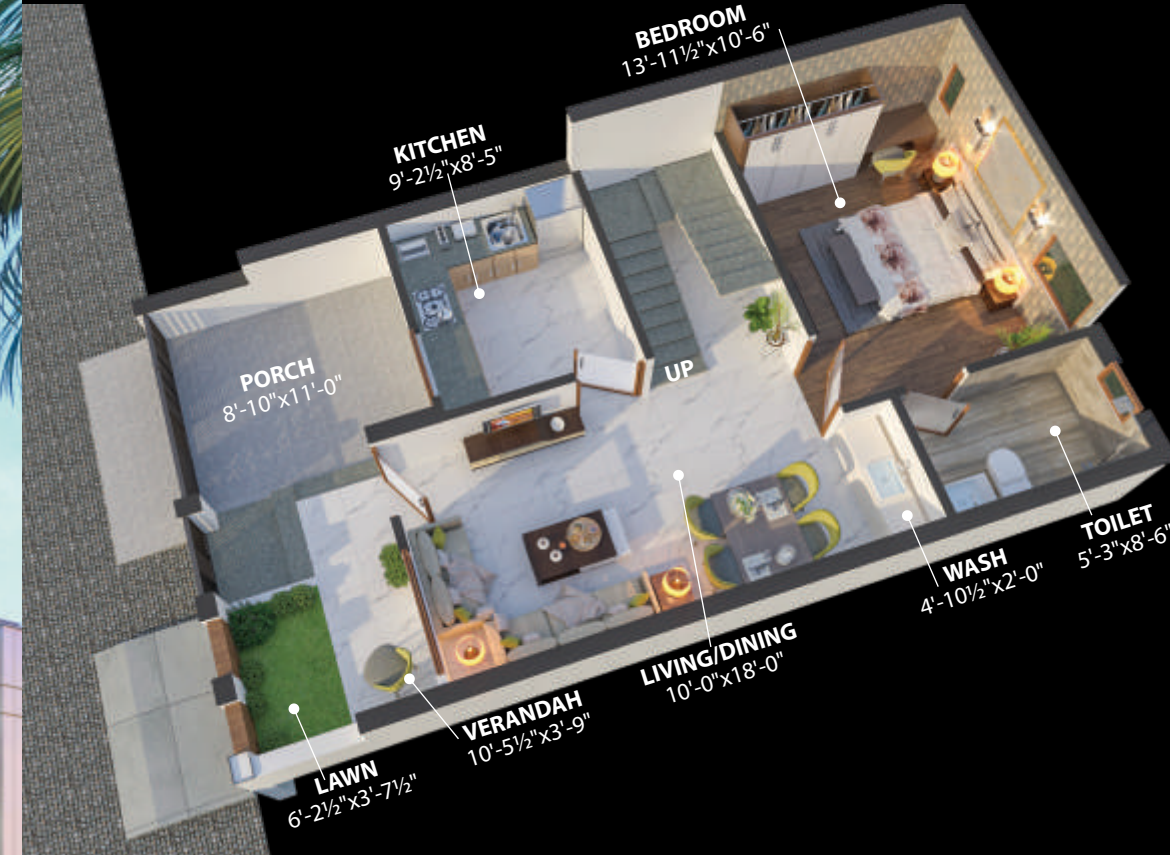
ग्राउंड फ्लोर प्लान